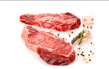
Entrecot de lomo 200 g