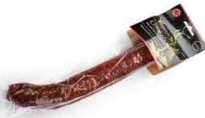
Chorizo de ciervo picante

Formato vela 250 g aprox. al vacío 16 kg por caja