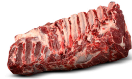
Lomo alto sin hueso

Bolsa de 2 a 3 kg al vacío / Caja de 20 kg +/-