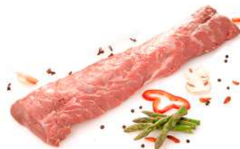
Cinta de lomo

Envasado al vacío. 18 Kg aprox. por caja.