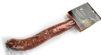
Salchichón de jabalí

Formato vela 250 g aprox. al vacío 16 kg por caja