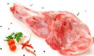
Paleta con hueso

Envasado al vacío. 18 Kg aprox. por caja.