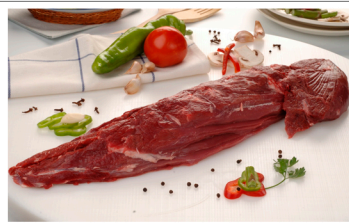
Solomillo +1,5 Kg