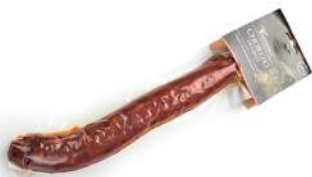
Chorizo de jabalí

Formato vela 250 g aprox. al vacío 16 kg por caja