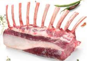
Chuletero corte Francés