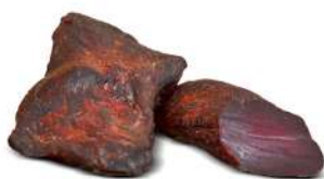
Cecina de Ciervo

Formato vela 250 g aprox. al vacío 16 kg por caja