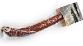
Chorizo de ciervo