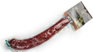
Salchichón de ciervo

Formato vela 250 g aprox. al vacío 16 kg por caja