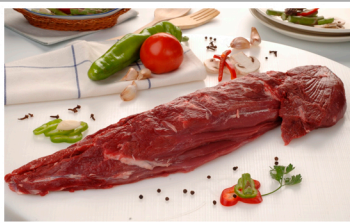
Solomillo +2,5 Kg