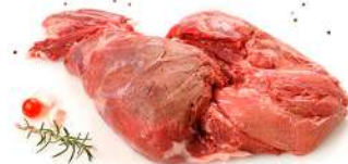
Pierna sin hueso

Envasado al vacío, 1 Kg aprox. por caja.