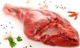
Pierna con hueso

Envasado al vacío. 17 Kg aprox. por caja.