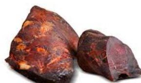
Cecina de Jabalí

Piezas de 300 a 600 g al vacío 16 kg por caja