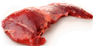
Cadera con rabillo