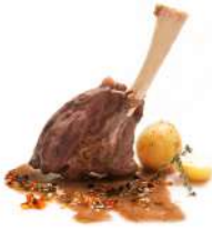
Jarretes de Ciervo Confitados