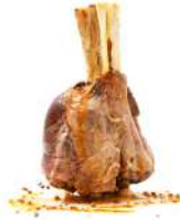
Jarrete de Toro Confitado