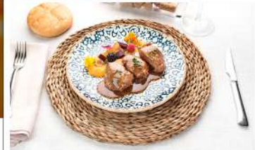
Carrillada de Cerdo confitada