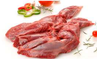
Paleta sin hueso

Envasado al vacío. 20 Kg aprox. por caja.