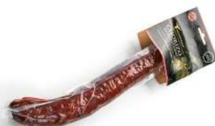
Chorizo de jabalí picante

Formato vela 250 g aprox. al vacío 16 kg por caja