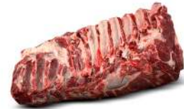
Carré Sans Os Faux-Filet