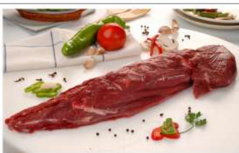
Filet +1 Kg