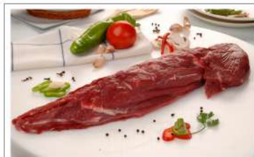
Filet +2 Kg