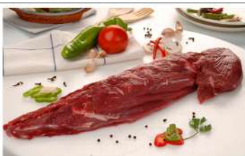
Filet +2,5 Kg