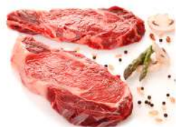
Entrecôte 200 g