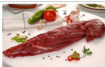
Filet +1,5 Kg