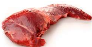
Rumsteak Avec Alguillette