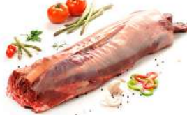
Dos avec Os