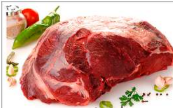
Tende de Tranche